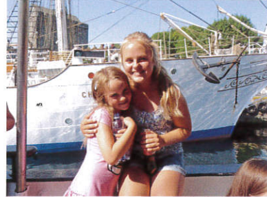
船長の孫娘 (ノルウェー/ベルゲン)