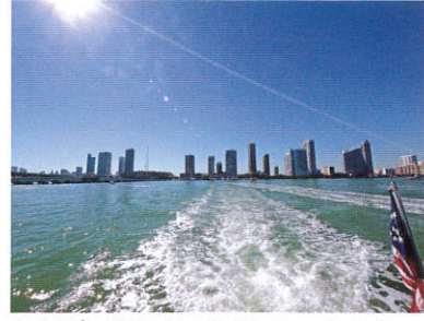
空と海の航跡 (アメリカ/マイアミ)