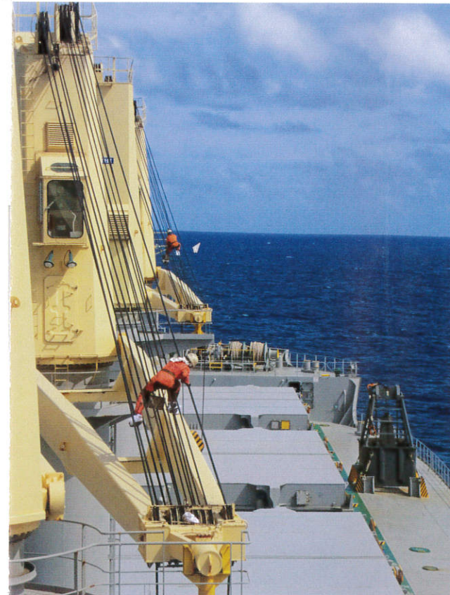
慎重な作業 (太平洋)

後援/ 横浜市教育委員会 (公財) 帆船日本丸記念財団 (公財) 日本海事広報協会 全日本海員組合 (一社) 海洋会 (一社) 全日本船舶職員協会 (一社) 日本船長協会 日本海事新聞社 神奈川新聞社 tvk (テレビ神奈川) <願不同> ●交通 JR根岸線「石川町駅」北口より徒歩10分 JR根岸線「関内駅」南口より徒歩15分 市営地下鉄「関内駅」 1番階段出口より徒歩15分 みなとみらい線 「元町中華街駅」より徒歩5分 「日本大通り駅」より徒歩5分 <車> 首都高速横羽線 「山下町ランプ」より5分 首都高速狩場線湾岸線 「新山下ランプ」より5分 <バス> 横浜駅東口よりバス20分 <シーバス> 横浜駅東口乗り場→ 「山下公園」まで(直行便)15分