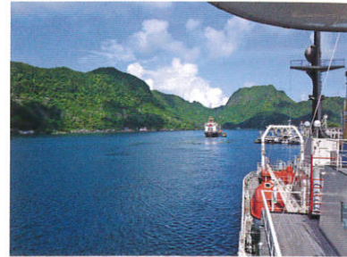
日付変更一番の地 (米領サモア/パゴパゴ)