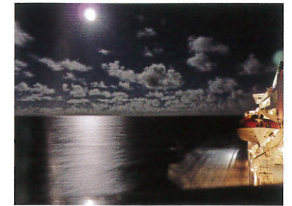
望月航路 (マリアナ諸島/バガン沖)