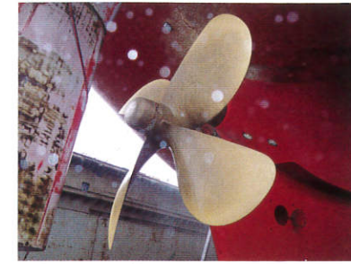
水中の扇風機？ (中国/青島)