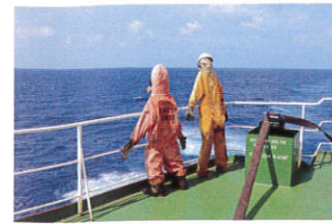
海賊当直中 (ペルシヤ湾)