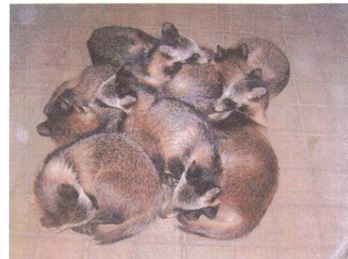
「これぞ本物・狸寝入り」は超珍品の1枚

自作の記録集「横浜狸物語」には出産間近の母親狸、授乳、じゃれ合い、お昼寝など文字通りの特徴シーンも。氏の狸一家一族への思いが伝わってくる。詳細・余録・雑感も総会でお楽しみ。