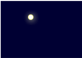
真っ暗な海に火が！

英国の Regulations for preventing Collisions at Sea 1863 を起源とする衝突予防法が国際的なものになったのですが、その灯火のなぜについてお話しします。