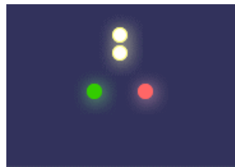
ハリケーンランプ