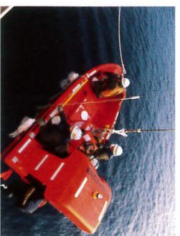
降下準備よし！（伊予灘）