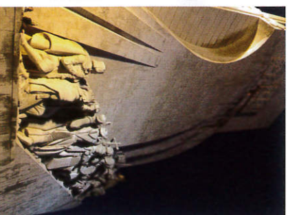
大航海時代の記憶 （ホテルカナル/ウスボン）