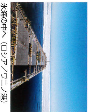
氷海の中へ（ロシア/クニノ港）